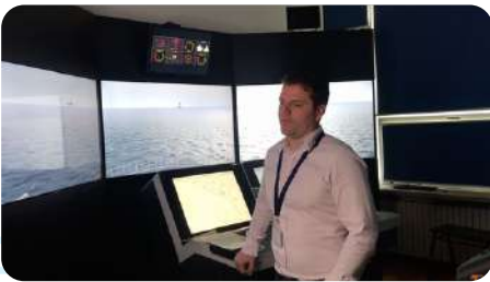
Eğitmen ve işveren