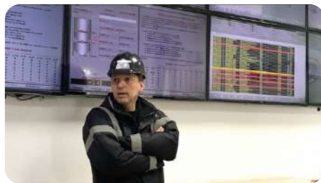
Yönetici ve çalışan